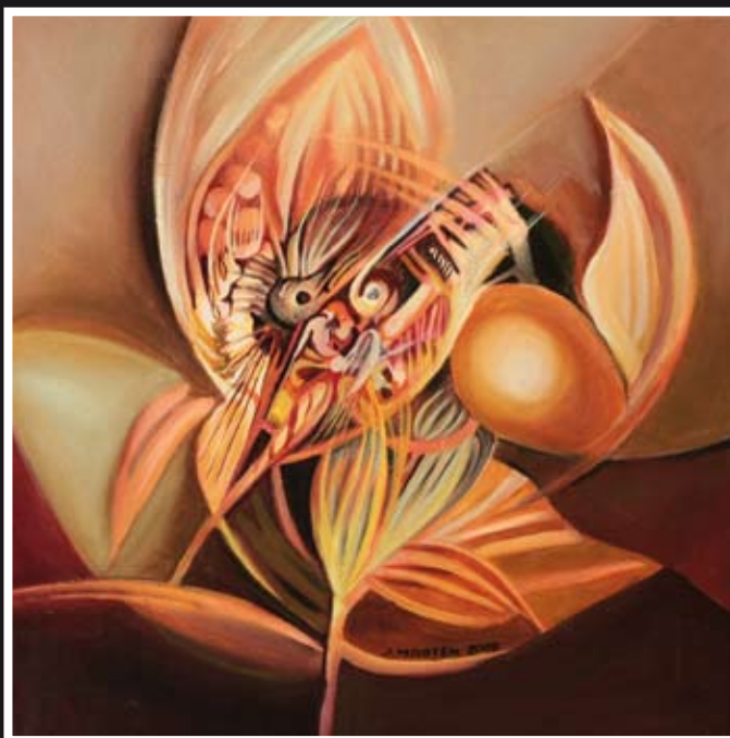
„Kompozycja XXXVI“ – olej, płótno, 40 x 40 cm