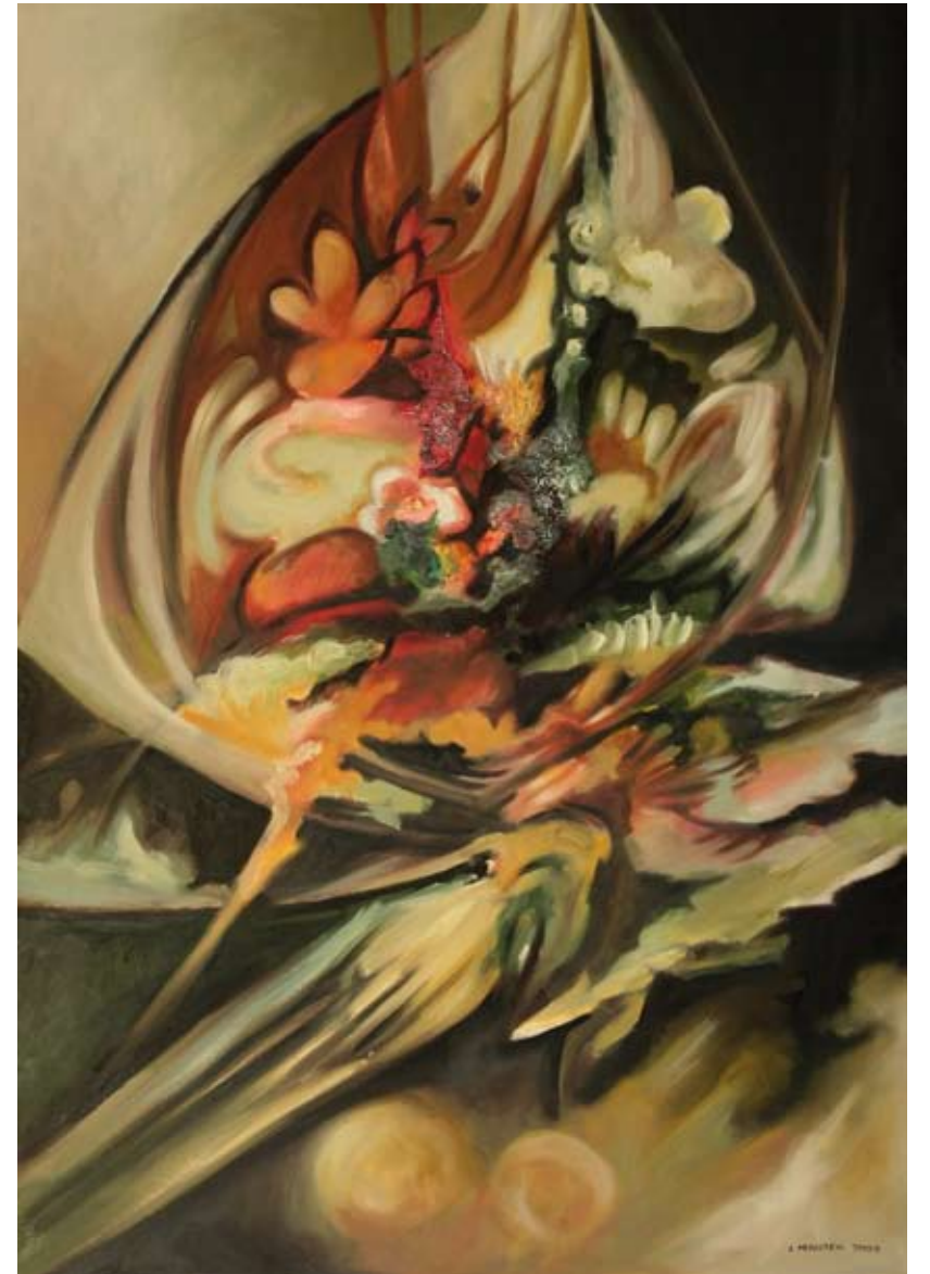
„Martwa natura z rybą“ – olej, płótno, 70 x 100 cm