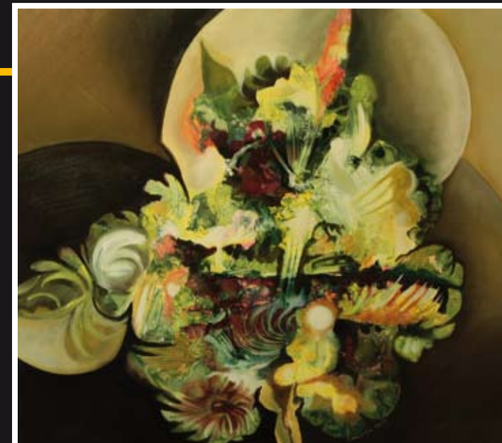
„Bukiet“ – olej, płótno, 73 x 65 cm