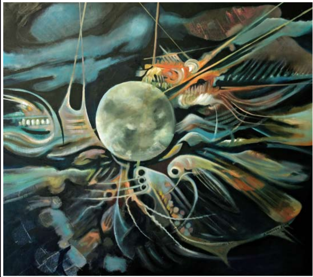
„Droga na Marsa“ – olej, płótno, 90 x 80 cm