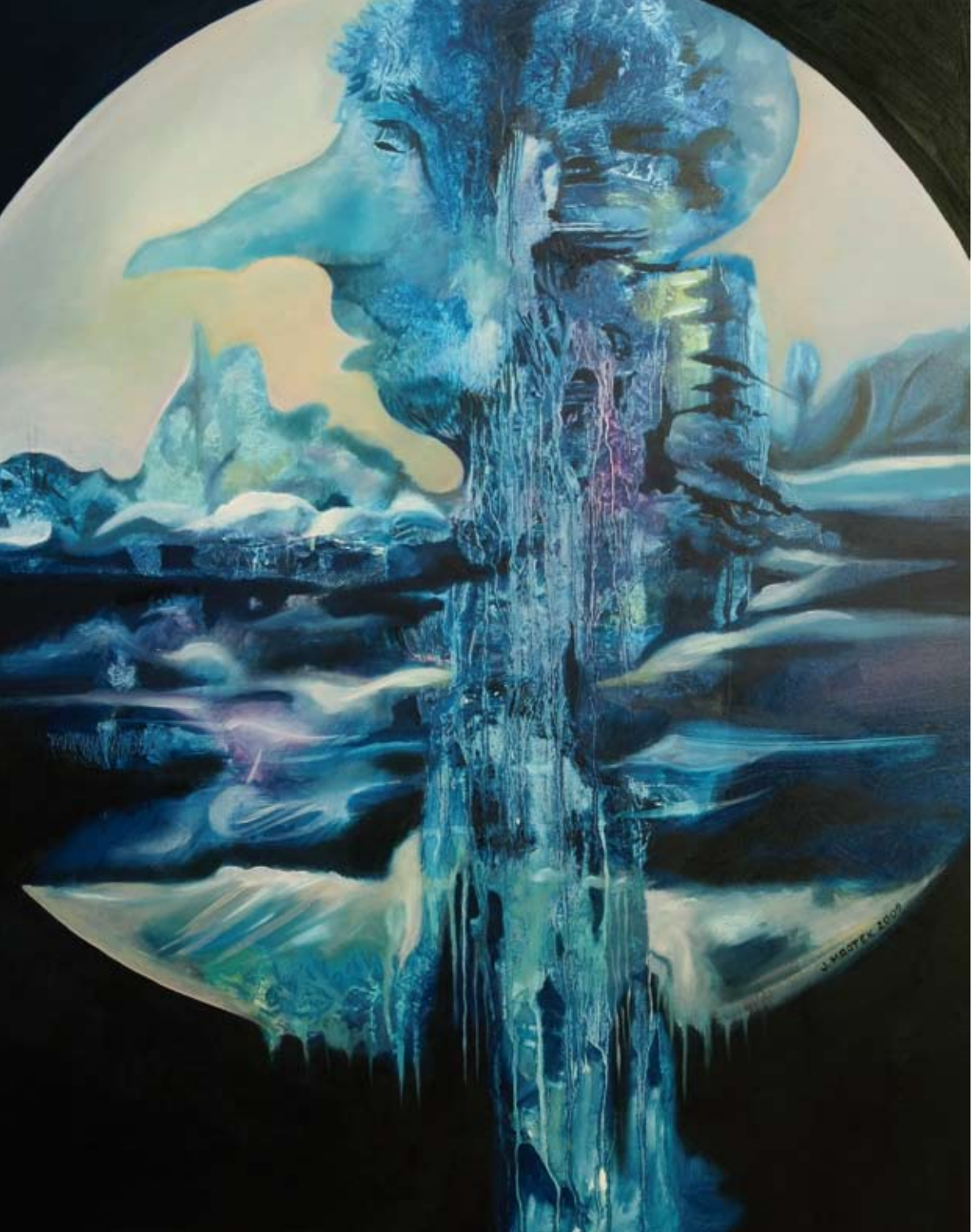
„Wodnik“ – olej, płótno, 73 x 92 cm