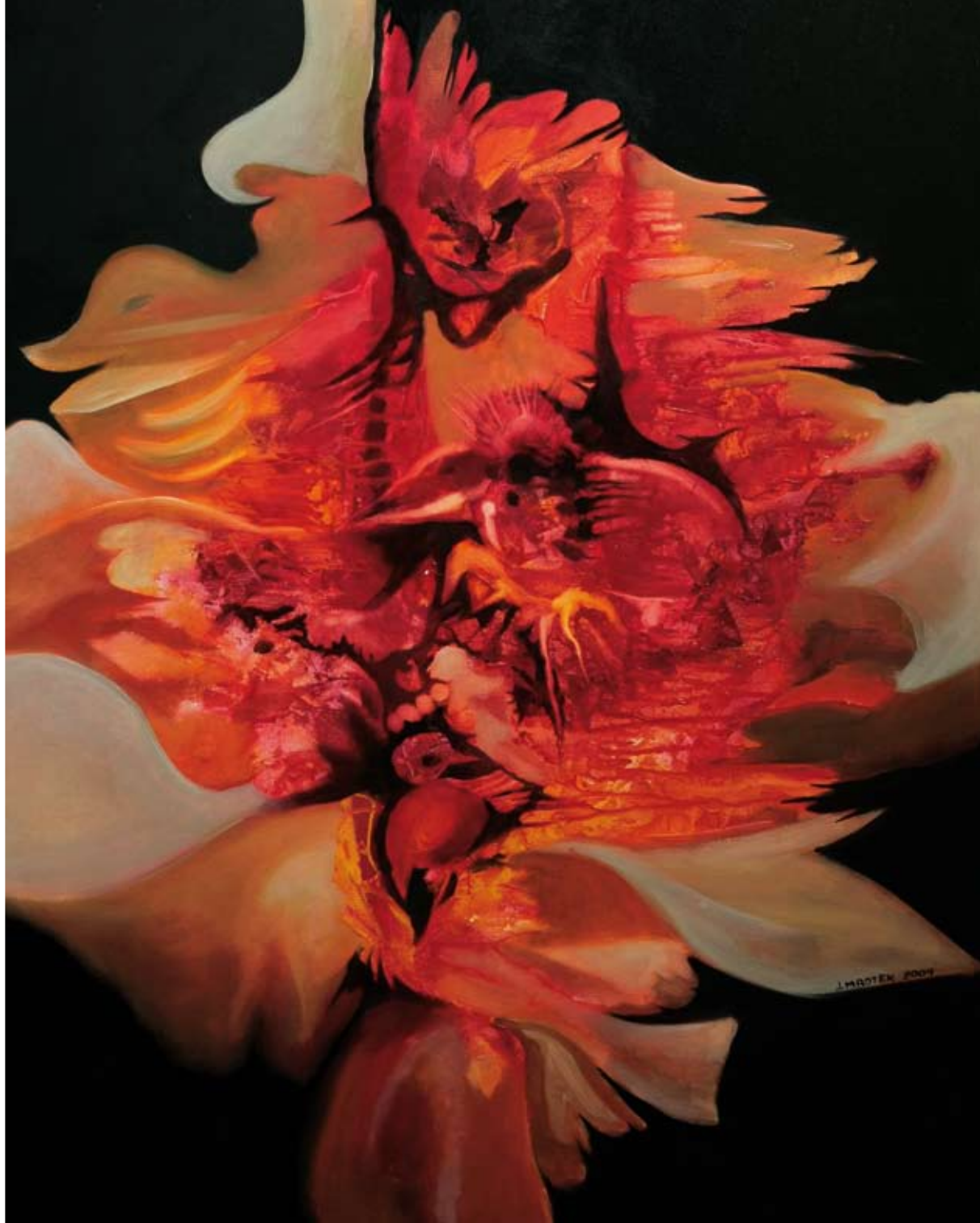
„Kompozycja z ptaszkami“ – olej, płótno, 70 x 90 cm