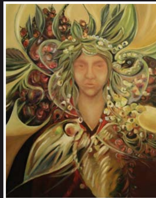
„Zeus“ – olej, płótno, 73 x 92 cm