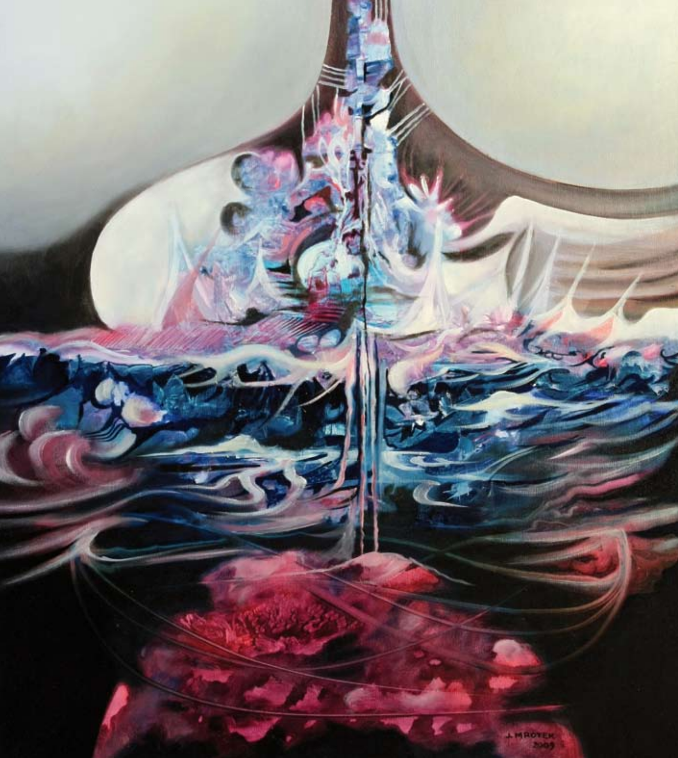
„Arka“ – olej, płótno, 65 x 73 cm