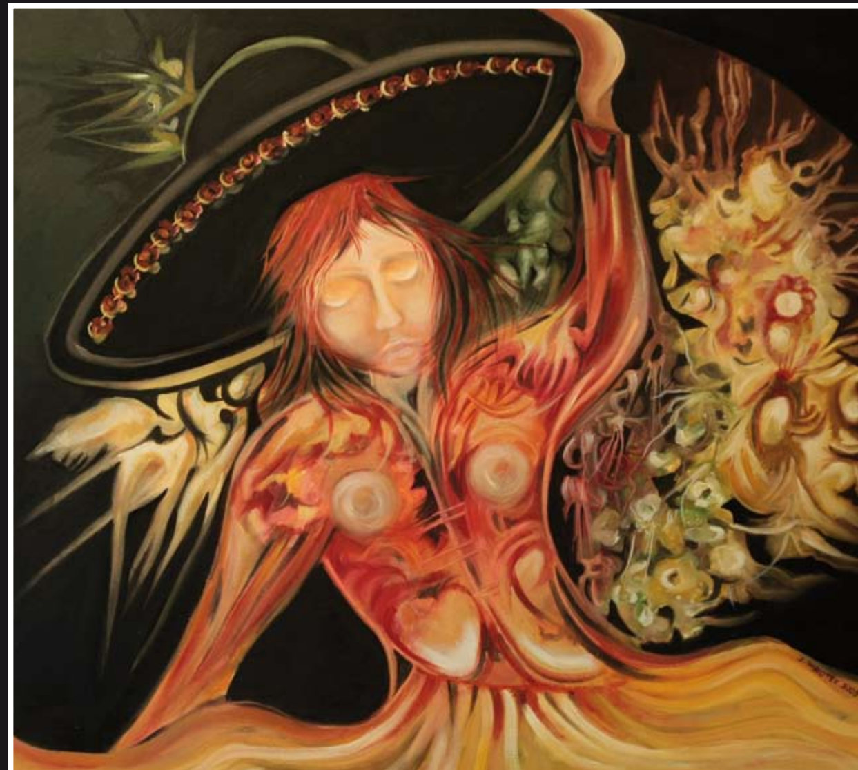
„Meksykanka“ – olej, płótno, 73 x 65 cm