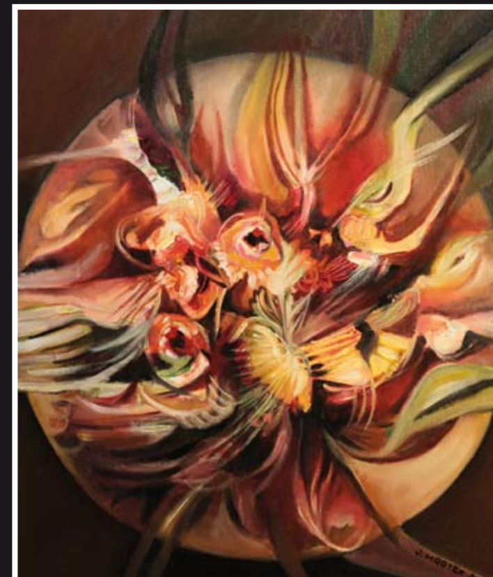
„Okno słońca“ – olej, płótno, 46 x 55 cm