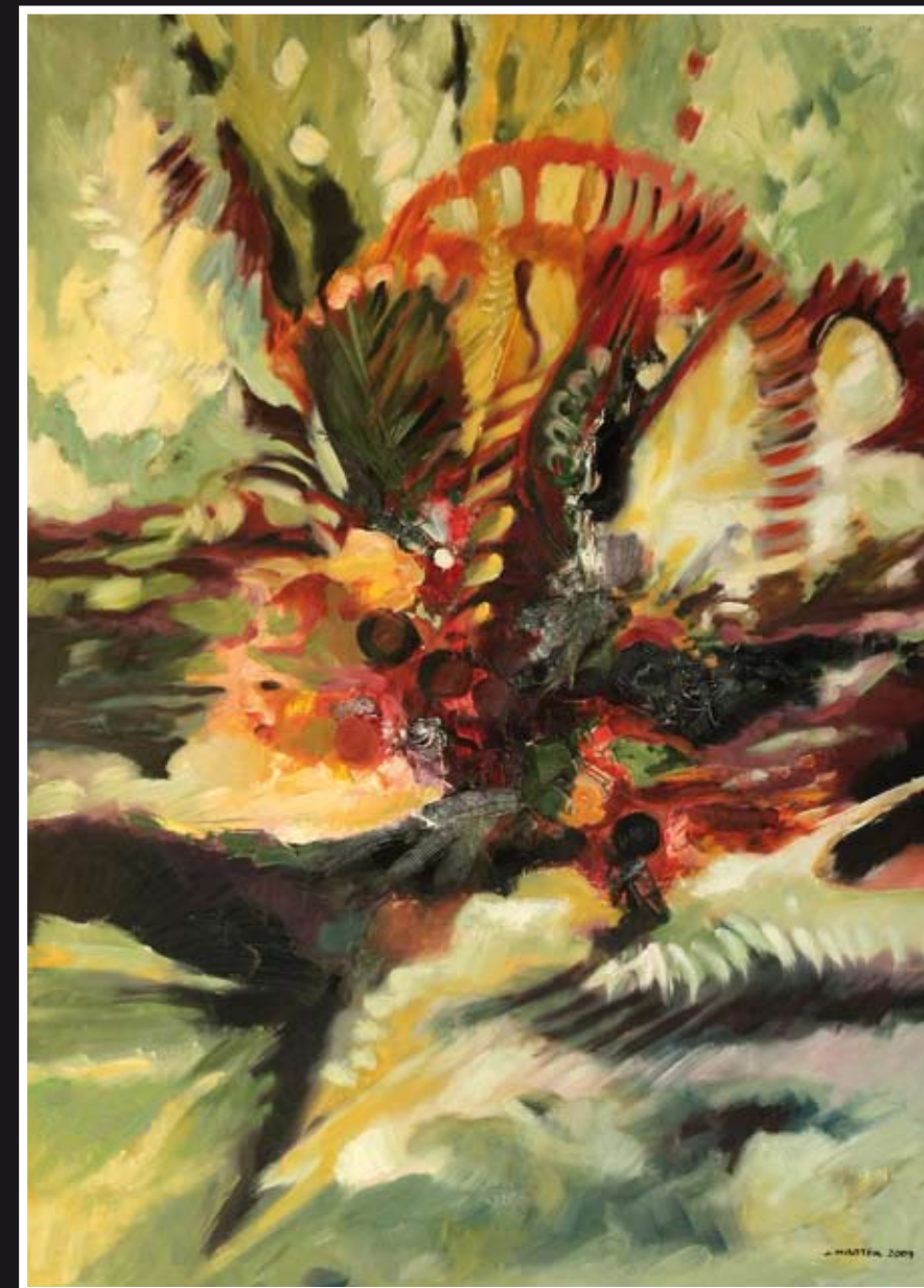
„Szał“ – olej, płótno, 73 x 100 cm