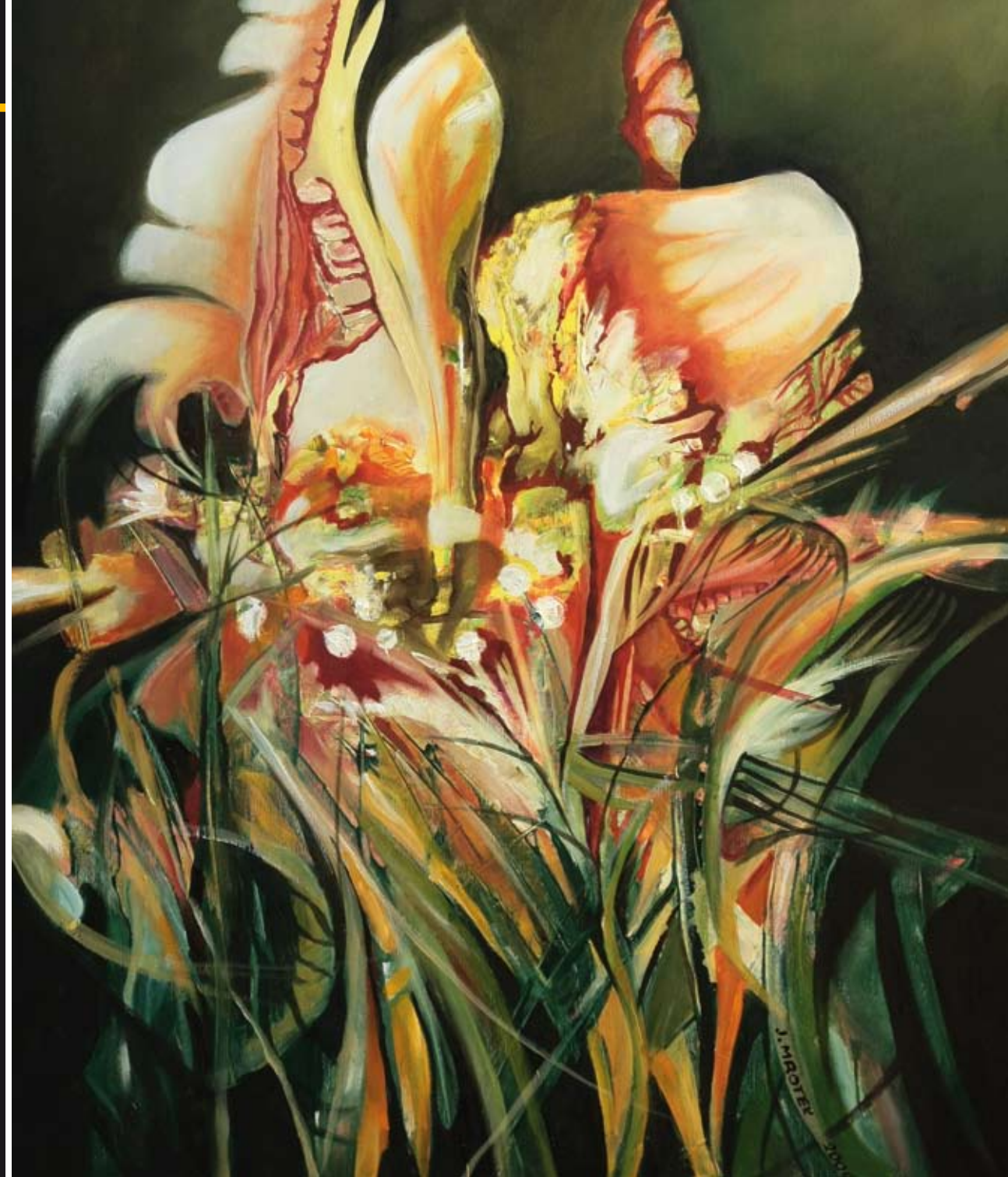
„Tatarak“ – olej, płótno, 54 x 65 cm