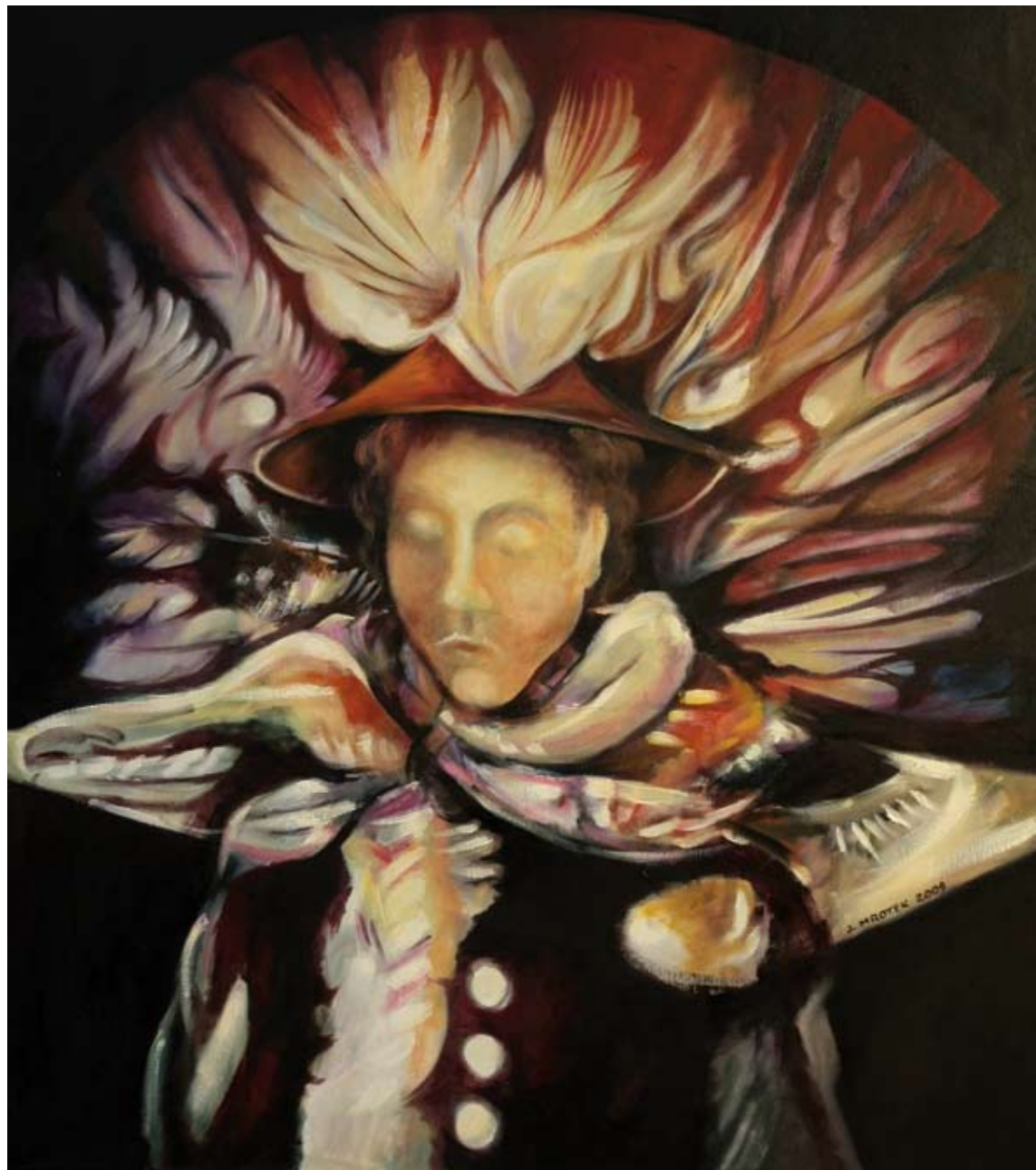
„Aktorka“ – olej, płótno, 65 x 73 cm