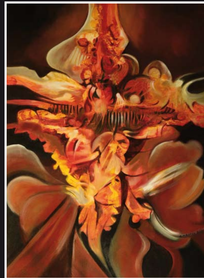
„Kompozycja XXXII“ – olej, płótno, 60 x 81 cm