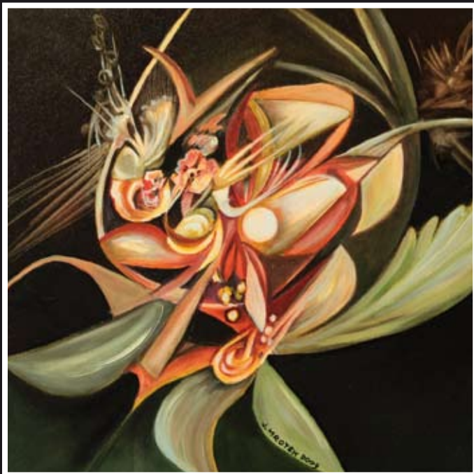
„Kompozycja XXXV“ – olej, płótno, 40 x 40 cm