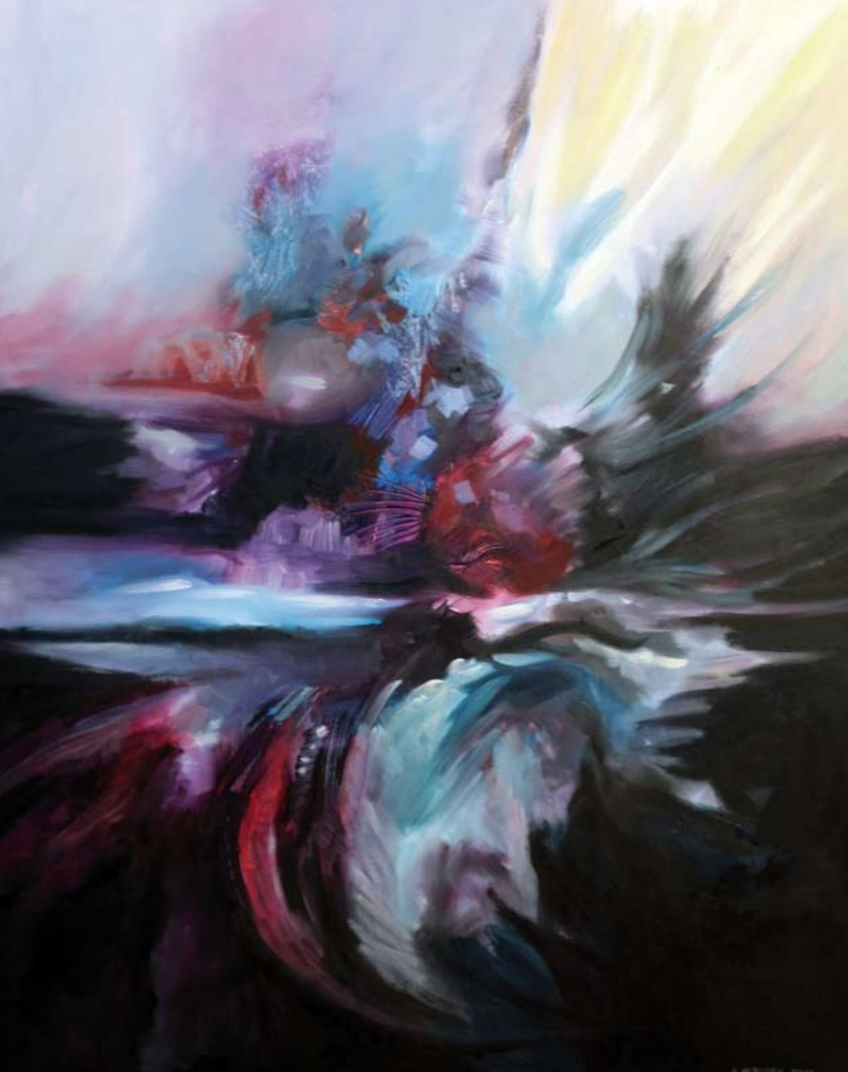
„Żywioł“ – olej, płótno, 73 x 92 cm